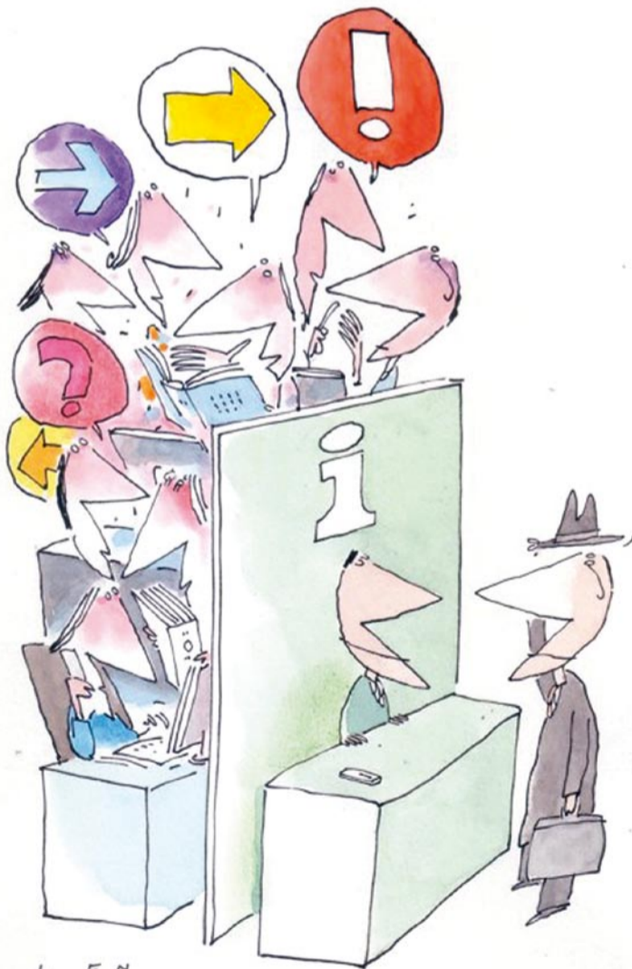
De schoonheid van de eenvoud van één loket...