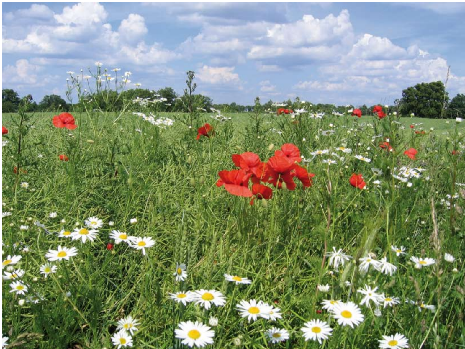
Dit vervuilde terrein kreeg een nieuwe 'natuur'-toekomst!

van een wisselwerking. Onder de noemer 'De kracht van 3D' voegde Drenthe daarom ook twee Klimaat-en-Energiedagen toe aan de door gedeputeerde Tanja Klip geopende week. Communicatiemedewerker Andrea van den Boogaart: "De bodem speelt een hoofdrol in ons energie- en klimaatvraagstuk. Die boodschap wilden we met verve uitdragen. Met onze activiteiten wilden we partijen en thema's met elkaar verbinden." Het doel was driedig: kansrijk omgaan met klimaat, energiebenutting en besparing en bewust bodemgebruik.