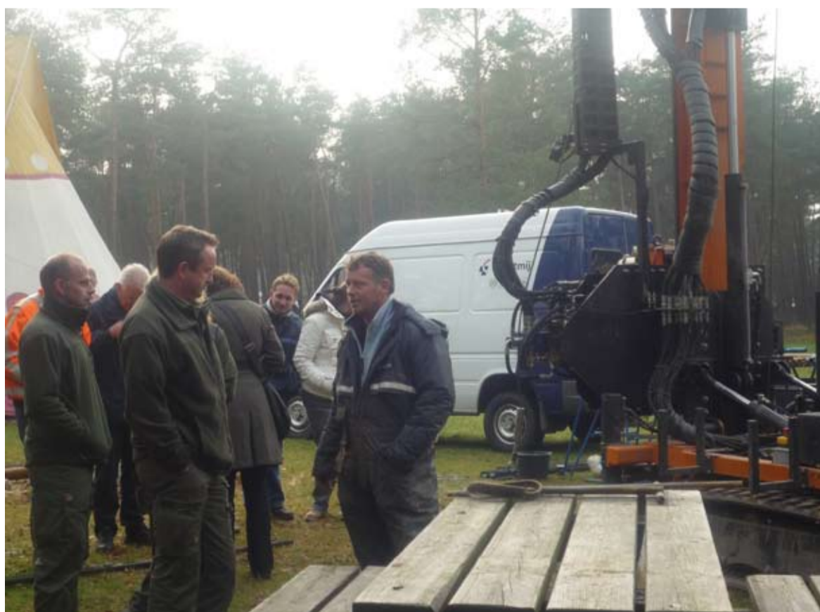
De 'Dag van het maatschappelijk debat' was een groot succes.

't Zeeuws bodemvenster. "Een hoogwaardige internettoepassing die beleidsmakers, planologen, gemeenten en gebiedsontwikkelaars moet wijzen op de mogelijkheden en beperkingen van de bodem en ondergrond binnen hun plangebied", legt Jonkers uit. Onderdeel van de applicatie is een op locatie gemaakte bodemfilm. Tijdens het symposium BodemBreed verzorgde Zeeland samen met Friesland en Zuid-Holland een sessie over de provinciale visie op duurzaam gebruik van bodem en ondergrond. Tegelijk wezen Gedeputeerde Staten het prachtige duingebied Oranjezon op Walcheren