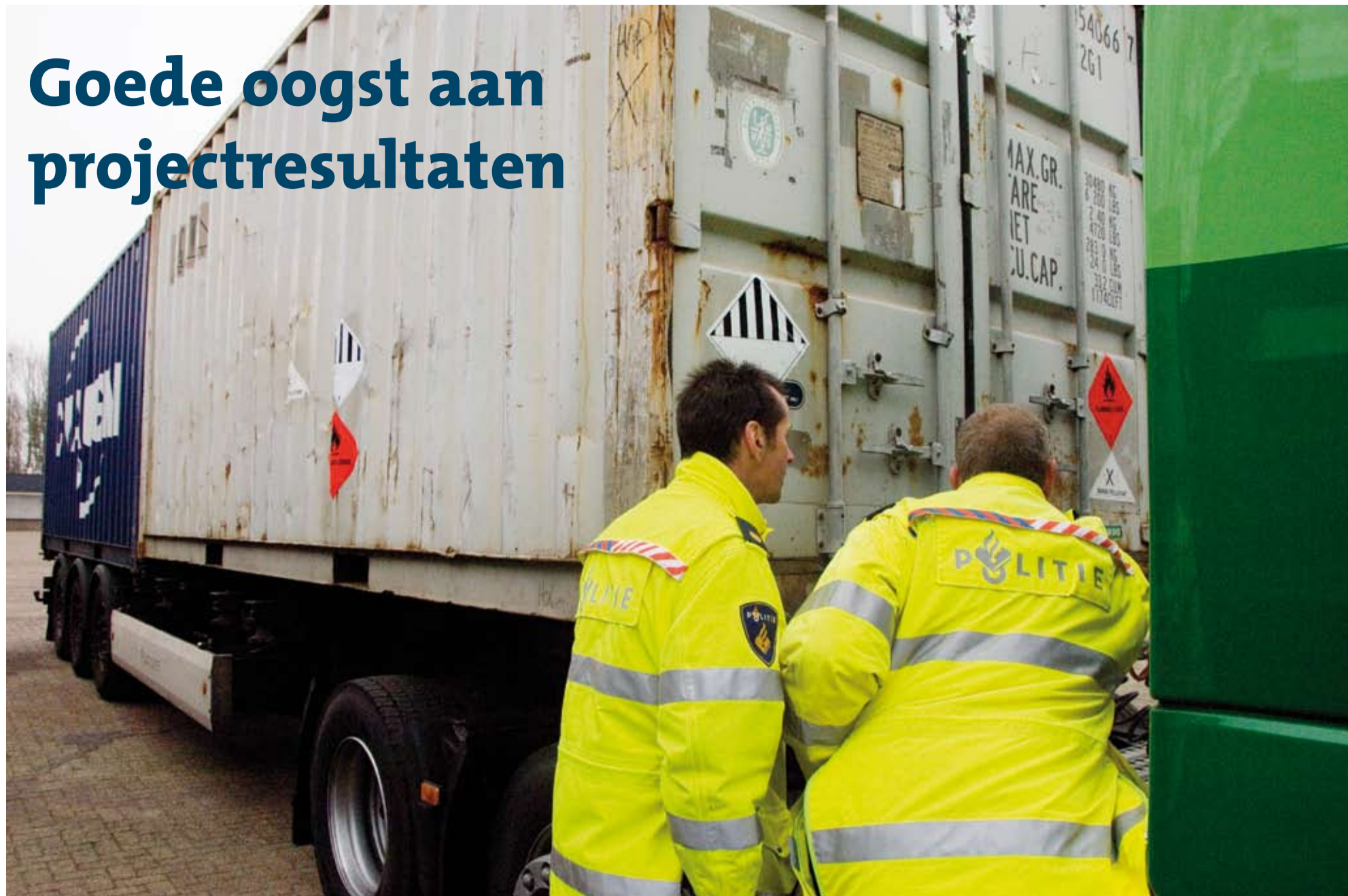
In interprovinciaal verband vormt het professionaliseren van de handhaving een van de speerpuntactiviteiten.