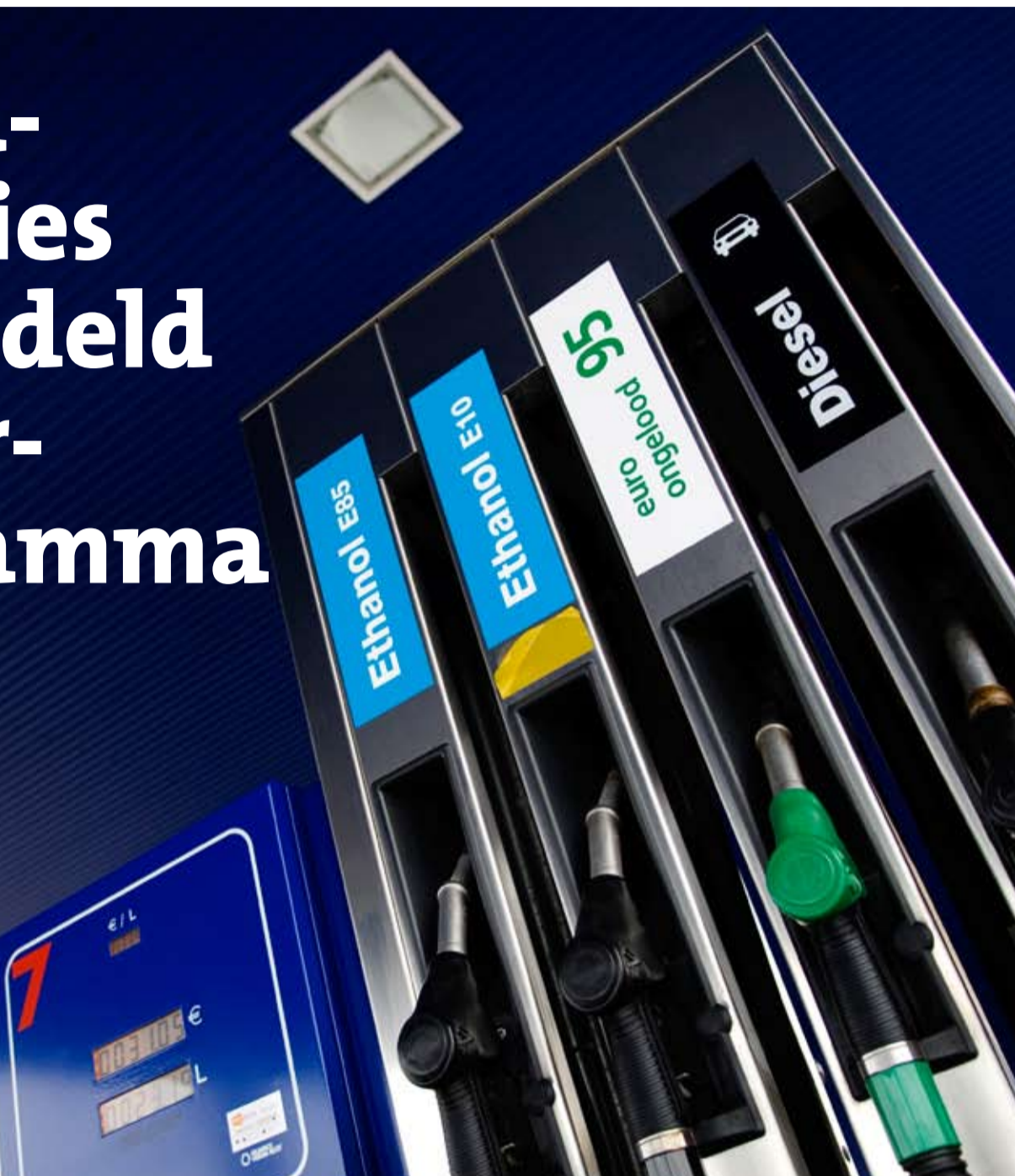
In 2008 komt er een campagne voor het rijden op schone en duurzame brandstoffen.

Na de provinciale verkiezingen in maart zijn er nieuwe colleges van Gedeputeerde Staten gevormd. Met nieuwe plannen, ook voor interprovinciale activiteiten. Alle gezamenlijke ambities staan in de IPO-Meerjarenagenda 2008-2011. Er verschijnt dus geen aparte Strategische Milieu Agenda meer. De milieuprojecten zijn gebundeld in het jaarprogramma PRISMA 2008.