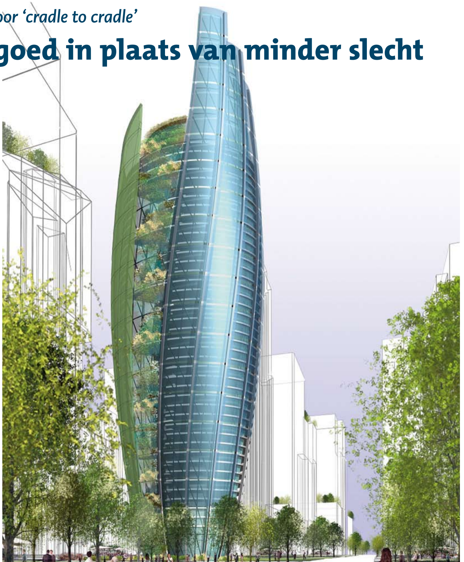
Artist impression van de Innovatoren voor de Floriade 2012 in Venlo. Illustratie: W. McDonough en partners.

Duurzaam ontwikkelen is de rode draad in het coalitieakkoord 'Investeren en verbinden' en de uitvoeringsprogramma's van de provincie Limburg. Daarbij zet de provincie vol in op het concept van 'cradle to cradle', oftewel 'van wieg tot wieg'. Het uitgangspunt hierbij is om het meteen goed te doen in plaats van minder slecht.