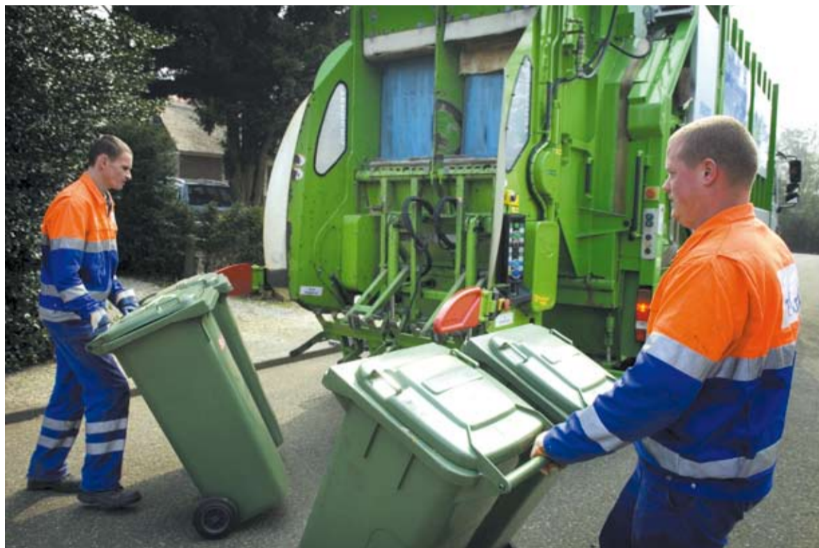
Eensgezindheid over de kernbegrippen in de afvalcyclus is van groot belang voor een goede handhaving, preventie en verwerking van ons afval.

De Europese Commissie komt in 2007 met een aantal voorstellen rond klimaatverandering. Provincies en gemeenten onderschrijven de noodzaak van maatregelen om dit probleem beheersbaar te houden. Zij hanteren bij dit dossier een integrale benadering. Daarbij gaat het om ruimtelijke ontwikkelingen,