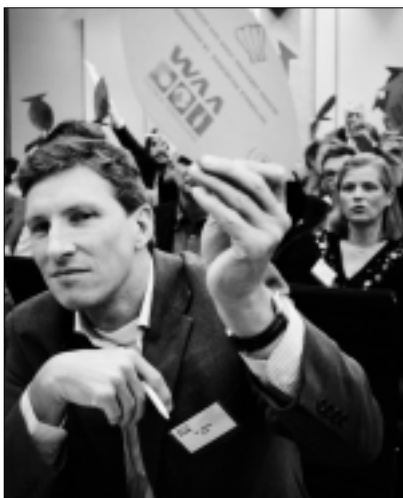
Met behulp van groene en rode vissen bepaalden de deelnemers welke suggesties echt kansrijk zijn.

Inzet van de Toekomstagenda is met minder geld meer doen. Belangrijk doel van de Nationale Milieudag 2005 was hiertoe concrete suggesties aan te reiken. Daar hadden de bezoekers duidelijk oren naar. Er ontstond een ware waslijst aan handreikingen. De vervuiling van het wegverkeer is bijvoorbeeld effectief te verminderen door meer aandacht te geven aan schonere motoren en nadrukkelijker in te zetten op biodiesel. Ook door het tanken te koppelen aan de ontvangst van CO 2 -emissierechten die men vervolgens weer kan inruilen voor bijvoorbeeld groene stroom. Duurzaam bouwen verdient eveneens meer stimulering. Veelal is in overheidsland nog onbekend dat deze bouw inmiddels goedkoper is dan de traditionele. Zorg er daarom voor dat milieucriteria ver-