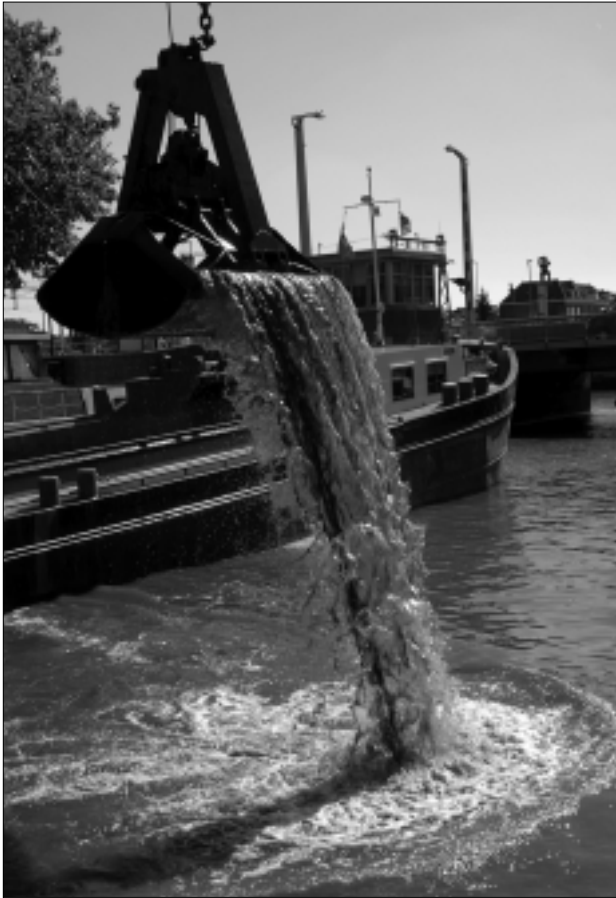
Het project Depot+ heeft geresulteerd in een concrete oplossing voor de waterbodempromatiek.

Op dit moment is het tempo waarin gebaggerd wordt te laag. Jaarlijks ontstaat er meer bagger dan er wordt weggehaald en daardoor is een grote achterstand ontstaan. Dankzij het project Depot+ schijnt er licht in de tunnel.