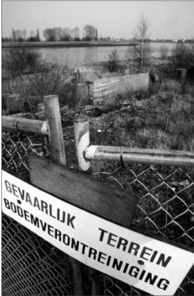
De aanvullende regels voor bodemsanering beogen een goede controle en handhaving.

De houdbaarheidsdatum van de Provinciale milieuverordening is altijd beperkt. Regelmatig stelt de IPO-adviescommissie Milieu nieuwe wijzigingen vast. Op 3 november gebeurde dat alweer voor de vierde keer sinds de IPO-Model-PMV in 1993 startte als gezamenlijk project van de provincies. Aangepast zijn de regels voor afvalverwerking, gesloten stortplaatsen, bodemsanering, stiltegebieden en de voorbereidingsprocedures.