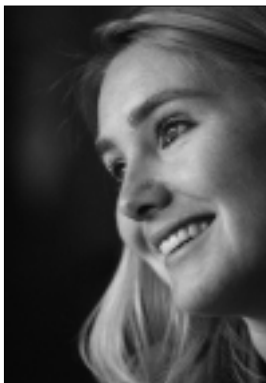
Staatssecretaris Schultz van Haegen: "We moeten het water niet zien als een nieuwe vijand, maar juist verwelkomen als een oude vriend."

Staatssecretaris van Verkeer en Waterstaat Melanie Schultz van Haegen benadrukte nog maar eens dat klimaatverandering geen kinderachtig onderwerp is. In het waterbeheer heeft het reeds een stevige plaats verworven. "Nederland loopt voorop, maar we zijn er nog niet", hield ze het publiek voor. "We moeten meer samenwerken met onze bovenstroomse bureaus en we moeten toe naar een nieuwe risicobebakening." Ze eindigde haar verhaal met een prachtige slogan, over het ondernemerschap van de Nederlanders in de afgelopen eeuwen en de rol van het water daarin. "We moeten het water niet zien als een nieuwe vijand, maar juist verwelkomen als een oude vriend."