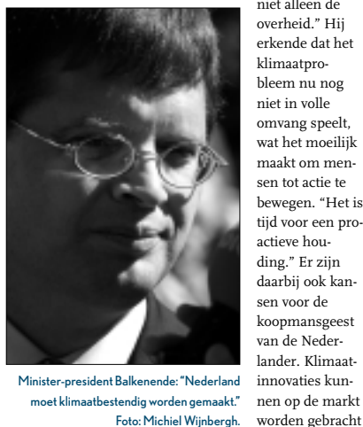
Minister-president Balkenende: "Nederland moet klimaatbestendig worden gemaakt."

"Het is glashelder dat daarvoor alle partijen nodig zijn, niet alleen de overheid."