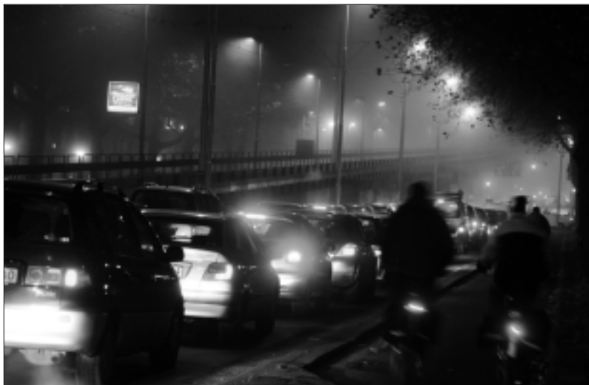
IPO en VNG werken aan een 'position paper' om in Brussel op te komen voor een goed en uitvoerbaar luchtkwaliteitsbeleid.

IPO en VNG zijn verheugd dat de twee documenten door de Commissie zijn gepubliceerd, omdat wij vinden dat het EU-beleid een belangrijke stap is naar een gezondere lucht. Met de kanttekening dat een snelle vaststelling van het EU-bronbeleid - vooral voor schoon wegverkeer - een voorwaarde is voor het halen van de luchtkwaliteitsgrenswaarden. Samen met de VNG werkt het IPO momenteel aan een 'position paper' om in Brussel op te komen voor een goed en uitvoerbaar luchtkwaliteitsbeleid. Via een DUV-dossierteam wordt dit standpunt ook afgestemd met het Rijk. Voor fijn stof stellen we voor de normen te beperken tot één grenswaarde, en wel bij voorkeur die voor PM 2,5 . Het gaat hier om een ambitieuze grenswaarde van de component die het meest