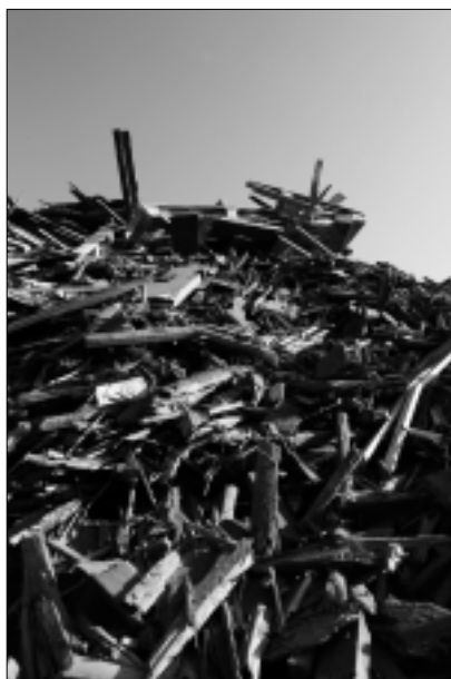
De milieubeweging beschouwt een aantal biomassaströmen en technieken als niet-duurzaam.

De provincies namen onder meer deel aan de stuurgroep BioEnergie Realisatie Koepel (BERK), die fungeerde als aanjager van het Actieplan. Andere deelnemers waren, naast de reeds genoemde ministeries, afval- en energiebedrijven en milieuorganisaties. Inzet voor dit jaar was het opstellen van een afsprakenpakket met oplossingen voor de meest essentiële vraagstukken rond bio-energie. De meest hardnekkige knelpunten waren: 1. Principieel: de milieubeweging beschouwt een aantal biomassaströmen en technieken als niet-duurzaam; 2. Inhoudelijk: nationale regelgeving voor emissies van verbrandingsinstallaties sluit niet aan op de Europese IPPC-richtlijn;