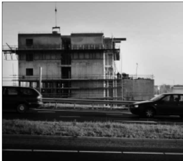
De Nieuwe Impuls is er om vastgelopen projecten op het gebied van ruimtelijke ontwikkeling, mobiliteit en milieu weer op gang te helpen.

Van te voren dachten we vooral vast te lopen in een oerwoud van regels. Velen leggen de schuld bij Brussel en de regels die 'ze' ons opleggen. Onze eigen inventarisatie leert ons dat dit vaak niet dé oorzaak is. De zondebok? Dat zijn we ook zelf! Veel problemen en oplossingen liggen dichterbij onszelf dan we vermoeden. We denken vaak niet als één overheid, we investeren onvoldoende in Europa en we benutten onvoldoende de kennis en creativiteit van burgers en bedrijven. We verkennen niet de échte wensen van burgers en lopen vast in bezwaren en beroepen. Intussen durven we ook geen risico's te nemen, fouten te maken en onderweg van missers te leren en onze aanpak te corrigeren. Daar wil Nieuwe Impuls wat aan doen. Door acties waarmee snel winst valt te boeken. Acties van overheden, bedrijfsleven én maatschappelijke partners samen. Met de uitvoering van de meest kansrijke acties willen we, als het even kan,